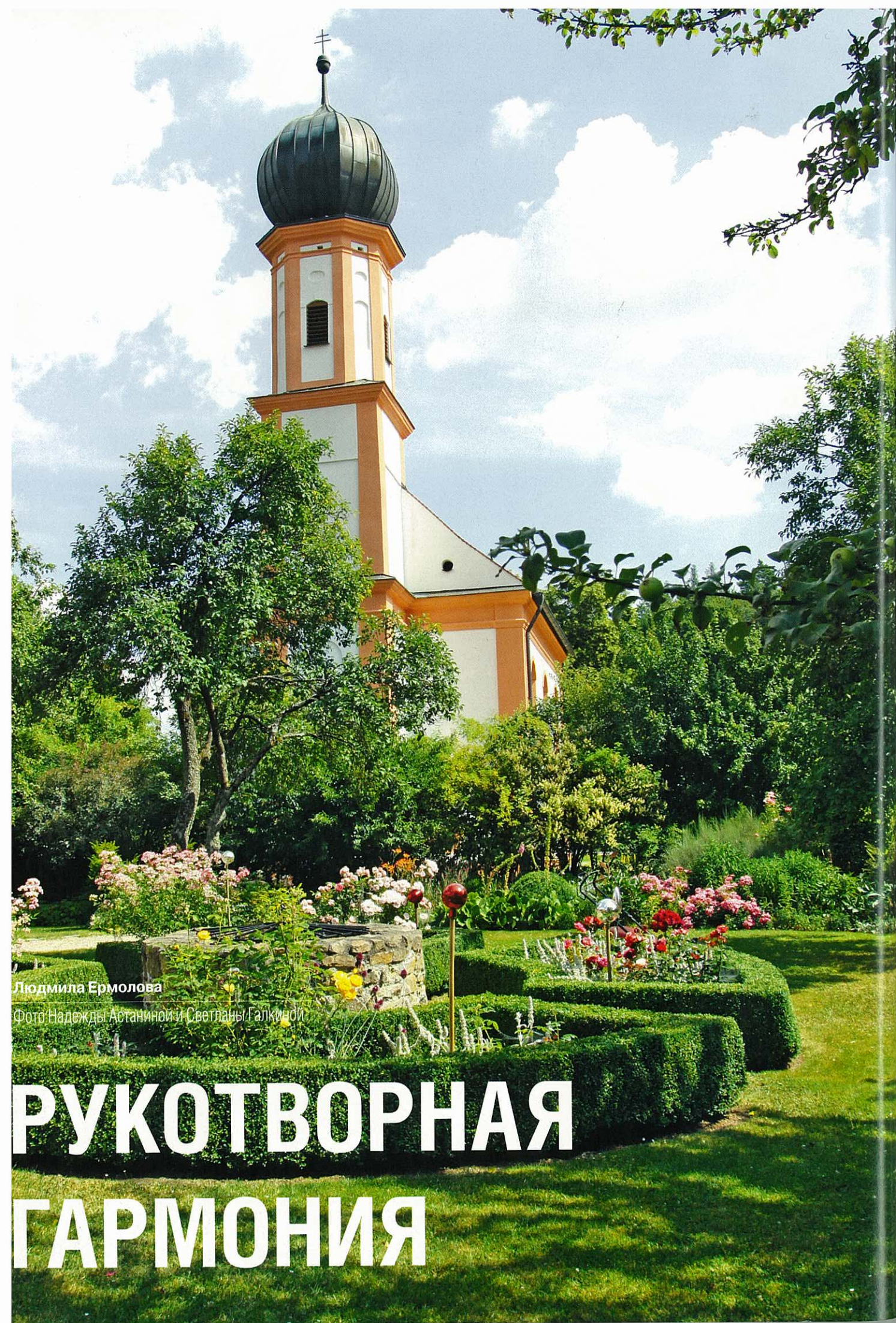
Людмила Ермолова